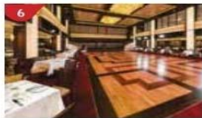
Dream Dining Room Savour a wide variety of Asian and international cuisine.