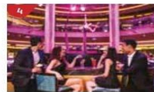
Bar 360 Catch live music and aerial acrobatic performances with a glass of champagne.